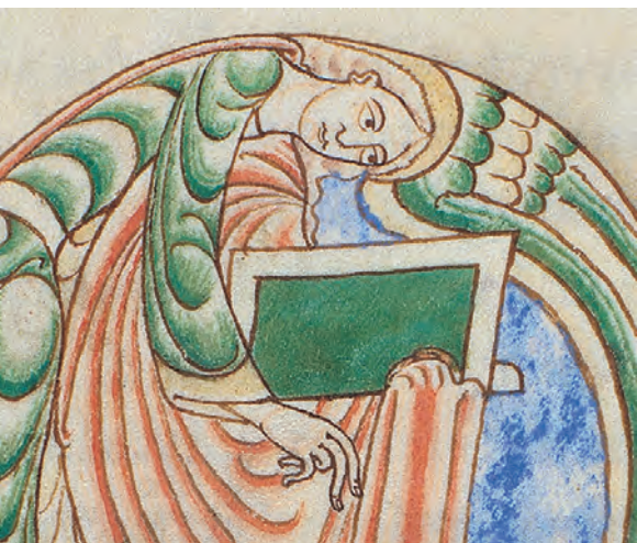
Les manuscrits de Cîteaux

DVD-Rom – PC – Bilingue français-anglais – Educagri éditions – 2007 ISBN 978-2-84444-510-0 – Réf. PC2701 – 25 €